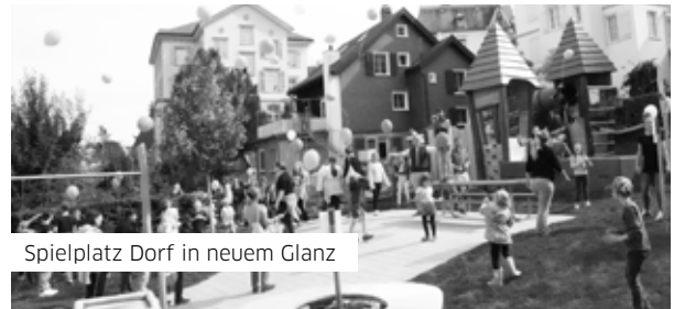
Spielplatz Dorf in neuem Glanz

CHF 166 350.– eingestellt. Die Nettokosten belaufen sich auf CHF 134 797.50 und liegen somit rund einen Fünftel unter dem Voranschlag. Die Minderkosten sind auf verschiedene kleinere Positionen, insbesondere jedoch auf den Nichtgebrauch der Reserven zurückzuführen. Die Sanierung des letzten Strassenabschnittes zwischen dem Dorfzentrum und Lachen erfolgt voraussichtlich ab Frühling 2025.