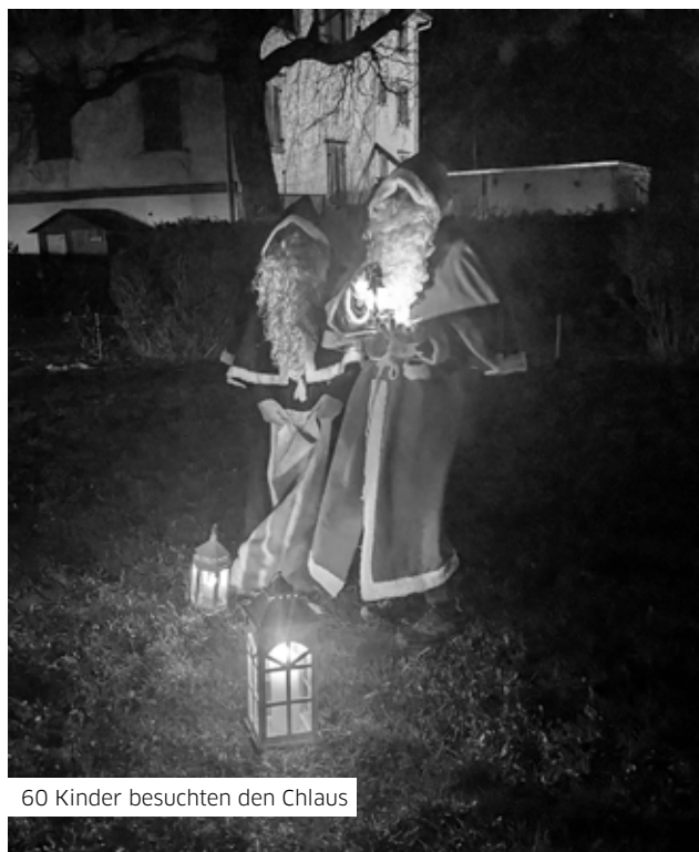
60 Kinder besuchten den Chlaus

Im Vereinslokal organisierten der Frauenverein Lachen und die Muettere Rundi eine Festwirtschaft und eine Bastelecke, wo die Familien den Abend ausklingen lassen konnten. An diesem windig kalten Dezemberabend ging man nach dem Chlausbesuch gerne wieder an die Wärme.