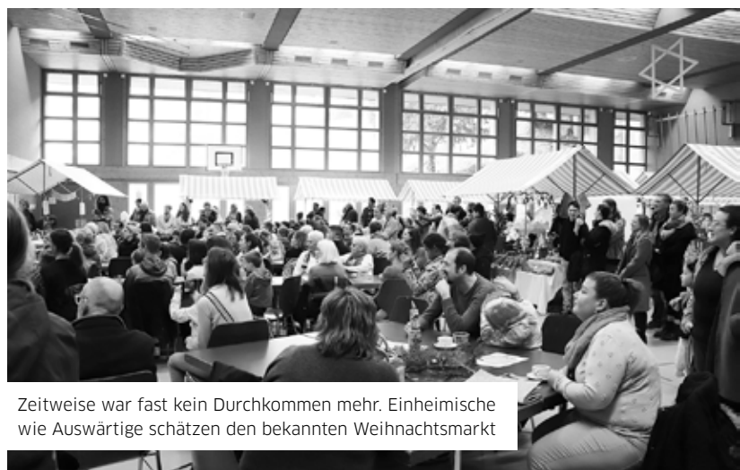
Zeitweise war fast kein Durchkommen mehr. Einheimische wie Auswärtige schätzen den bekannten Weihnachtsmarkt