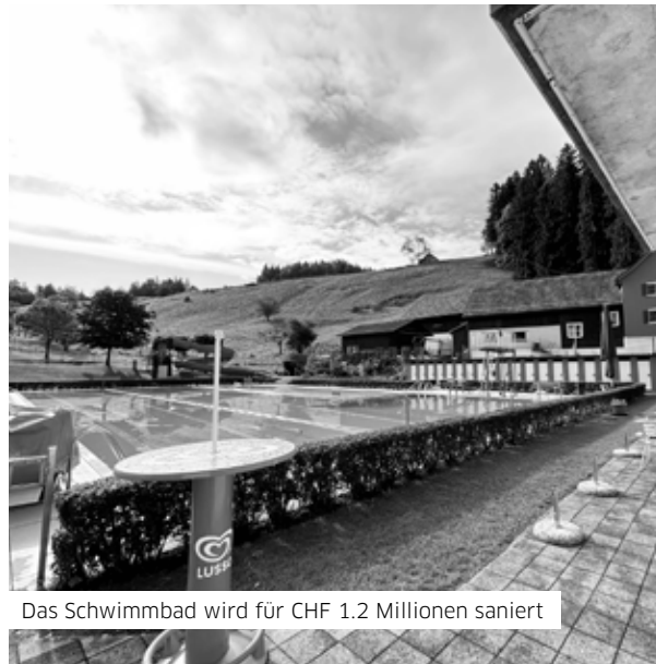
Das Schwimmbad wird für CHF 1.2 Millionen saniert

Der Gemeinderat bedankt sich für das ausgesprochene Vertrauen und das Mittragen der Vorhaben. Dies ermöglicht der Gemeinde die aufgelaufenen Unterhaltsarbeiten und Investitionen in die Infrastruktur aktiv anzugehen. So stehen auch den nächsten Generationen weiterhin optimale und nutzbare Liegenschaften zur Verfügung.