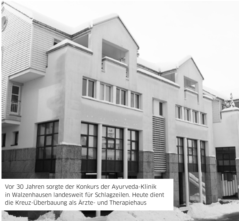
Vor 30 Jahren sorgte der Konkurs der Ayurveda-Klinik in Walzenhausen landesweit für Schlagzeilen. Heute dient die Kreuz-Überbauung als Ärzte- und Therapiehaus

Mit einer beispiellosen Medienkampagne wurde Ende Mai 1992 in Walzenhausen die erste ausserhalb Indiens eingerichtete Ayurveda-Klinik eröffnet und hochgejubelt. Am Tag der offenen Türe traten sich Hunderte neugieriger Besucher auf die Füsse, und der Zulauf von Kurgästen war enorm. Der 1994 erfolgte Konkurs war ein gewaltiger Paukenschlag.