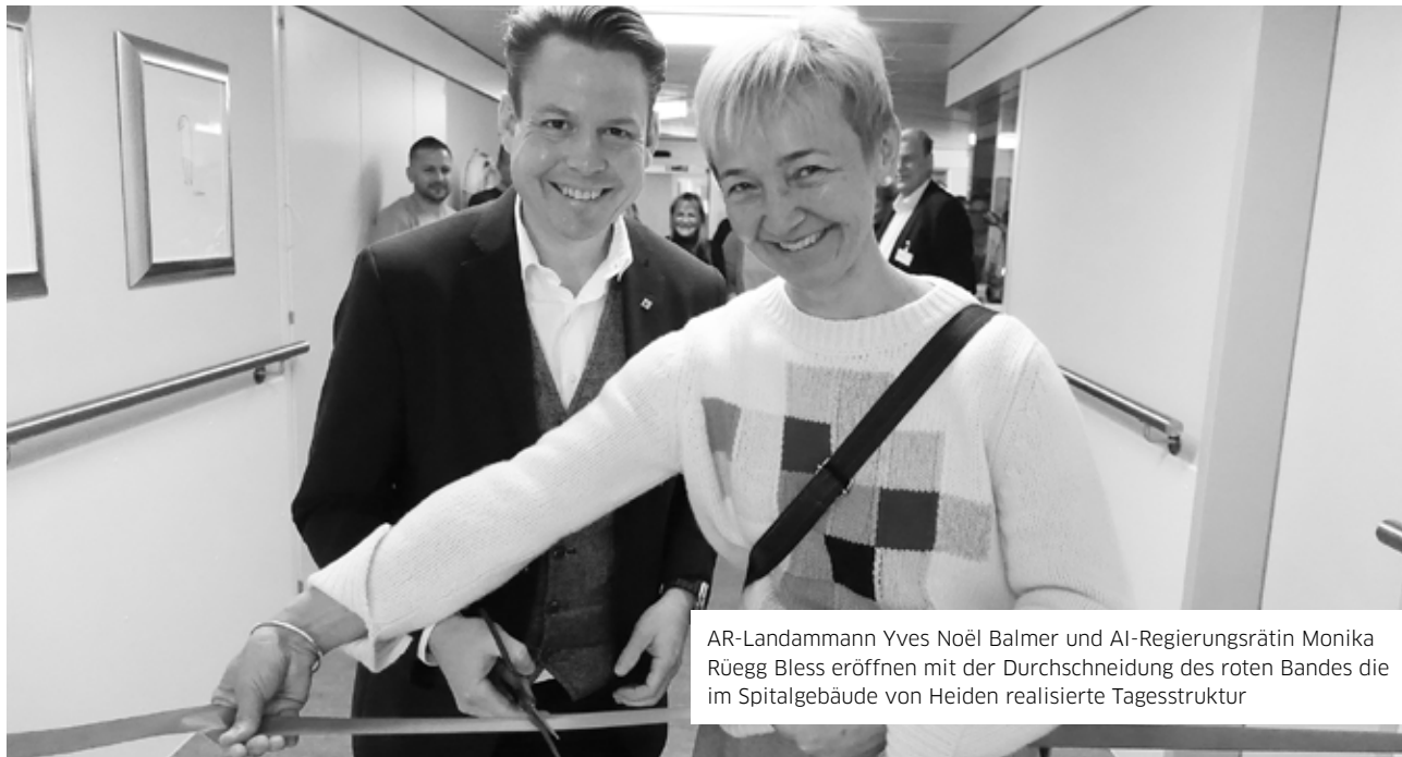
AR-Landammann Yves Noël Balmer und AI-Regierungsrätin Monika Rüegg Bless eröffnen mit der Durchschneidung des roten Bandes die im Spitalgebäude von Heiden realisierte Tagesstruktur

Am 24. November wurde die im ehemaligen Spitalgebäude von Heiden verwirklichte Tagesstruktur mit viel Prominenz eröffnet.