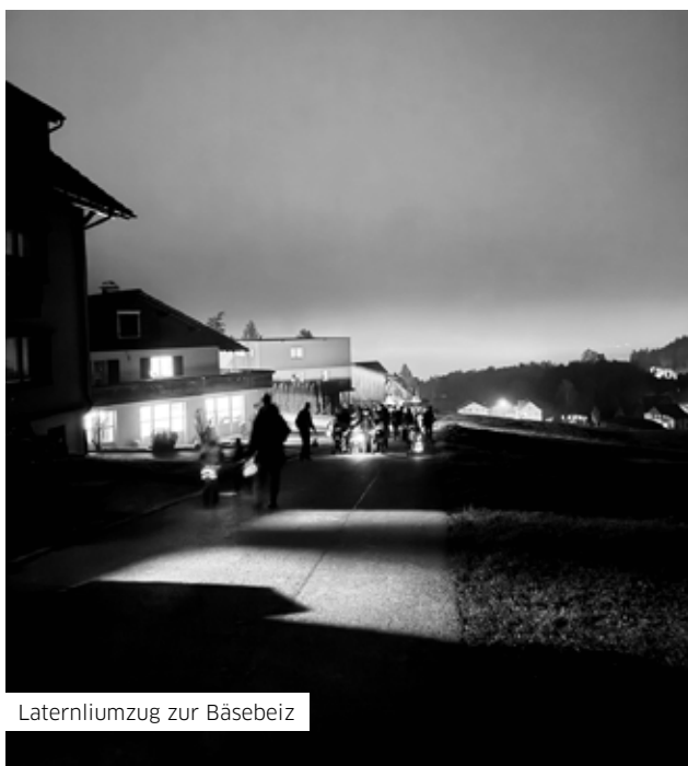
Laternliumzug zur Bäsebeiz

In der Bäsebeiz angekommen, durften wir im Stall Platz nehmen, wo uns Familie Fitze mit Glühwein, Punsch und Wienerli verpflegte. Ein grosses Dankeschön an Familie Fitze für die herzliche Gastfreundschaft und die erwärmende Verpflegung.