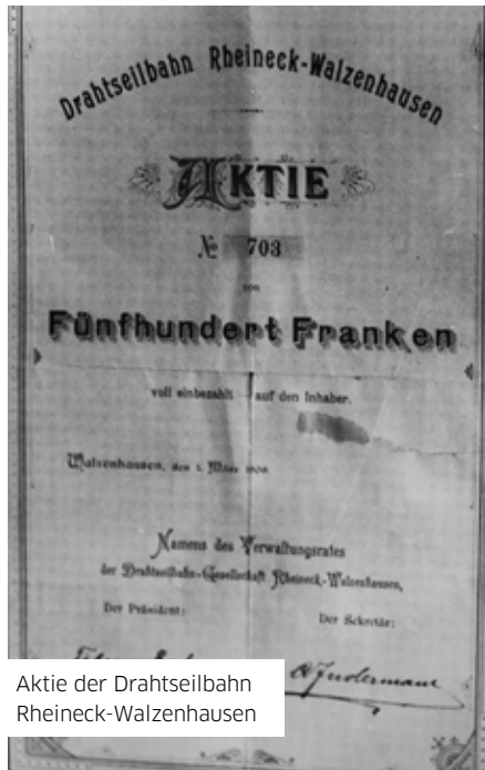
Aktie der Drahtseilbahn Rheineck-Walzenhausen