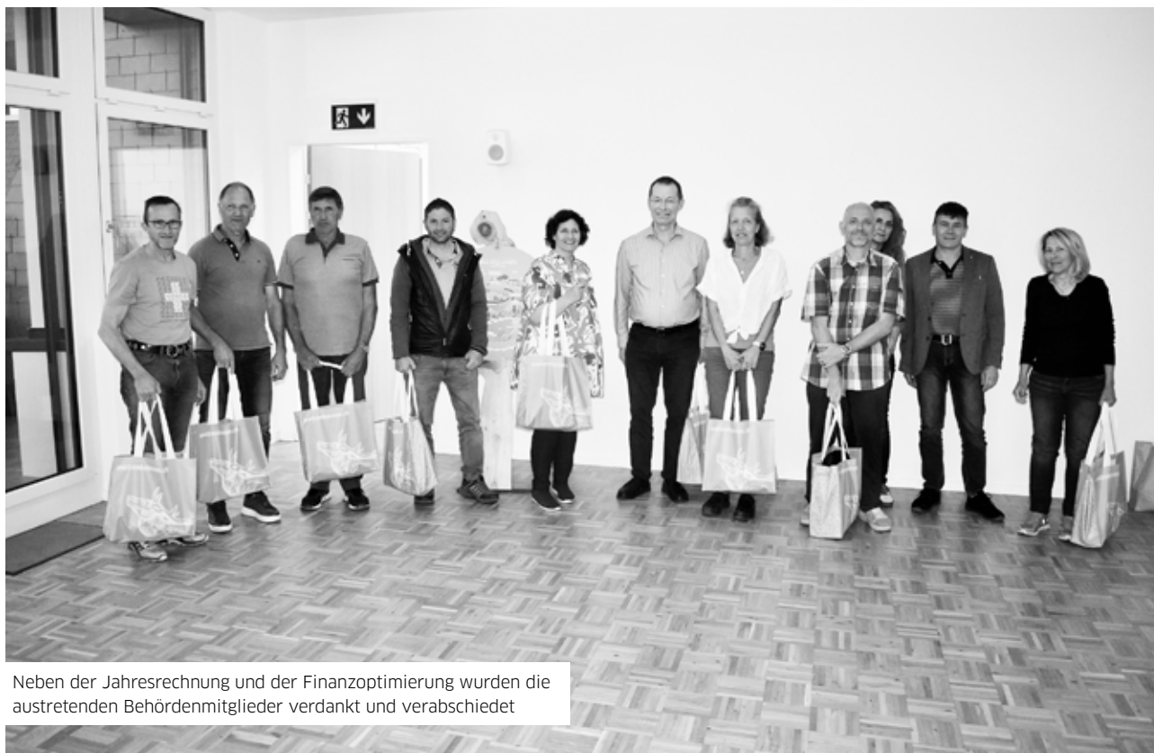
Neben der Jahresrechnung und der Finanzoptimierung wurden die austretenden Behördenmitglieder verdankt und verabschiedet

«Mogelpackung», weil es Lasten vom Kanton zu den Gemeinden verschiebe.