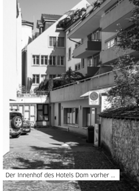
Der Innenhof des Hotels Dom vorher ...

«Mit der Aufwertung im Innenhof haben wir für alle Angestellten einen Pausenplatz geschaffen, der auch für das Klima und die Natur was zu bieten hat.»