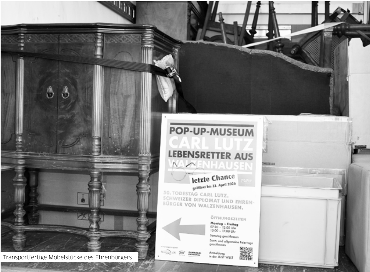
Transportfertige Möbelstücke des Ehrenbürgers

Gemeinde Walzenhausen. Dieser Tage hat das Museum seine Türen geschlossen. Die Ausstellungsgegenstände, unter anderem persönliche Möbelstücke des Ehrenbürgers, werden bis zum nächsten Einsatz bei der Stiftung eingelagert. Mit den Worten des Gemeindepräsidenten: «Diese Rettungsaktion soll uns Vorbild in der heutigen Zeit sein und uns ermutigen, uns für die Mitmenschen einzusetzen», schliesst sich ein Jahr voller Erinnerungen an den Schweizer Diplomaten aus Walzenhausen.