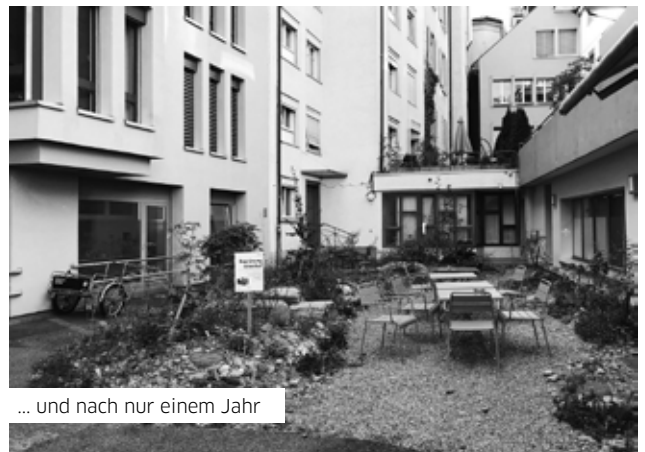
... und nach nur einem Jahr